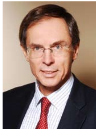
prof. Jan Švejnár, ekonom, Michiganská univerzita

jsou pro lidi důležité a kde má poskytovatel služby lepší informace o kvalitě služby než klient.