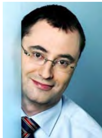
MUDr. Boris Šťastný poslanec, místopředseda Výboru pro zdravotnictví PS PČR

3. Paliativní péče v pediatrii je odlišná od problematiky dospělých. Umírající dítě potřebuje odlišný přístup v závislosti na věku, velmi důležitá je spolupráce rodiny nemocného dítěte. Paliativní péče se vyvíjela v subspecializaci v rámci pediatrie.